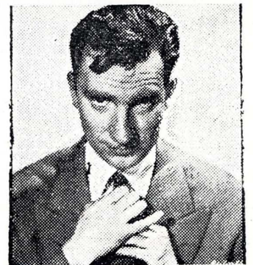
El famoso actor cinematográfico Fernando Fernán Gómez, que actuará de locutor